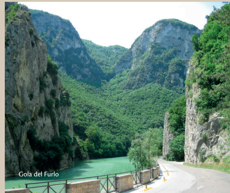
Gola del Furlo